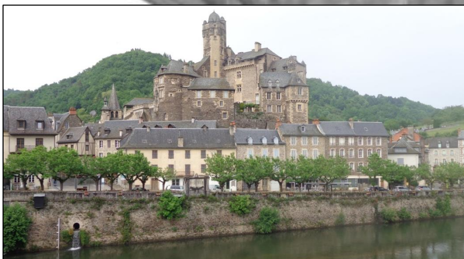
Ci-contre: Estaing et son château appartenant à Giscard.

L'Aubrac est un haut plateau délimité par le Lot au Sud. Entre les deux, mille mètres de dénivellation à dévaler. Sous les crêtes, de nombreux petits villages sont disséminés sur un replat avant les pentes abruptes vers le Lot. C'est donc sans peine que je rejoins l'Olt. Je descends la vallée sous la bruine à 30km/h, ce matin, je me trainais pour monter sur le Forez. Les randonnées longues distances demandent de la résilience, de ne pas flancher et de croire en ses capacités de récupérations et surtout, dans les moments difficiles, ne pas prendre de décision hâtive.