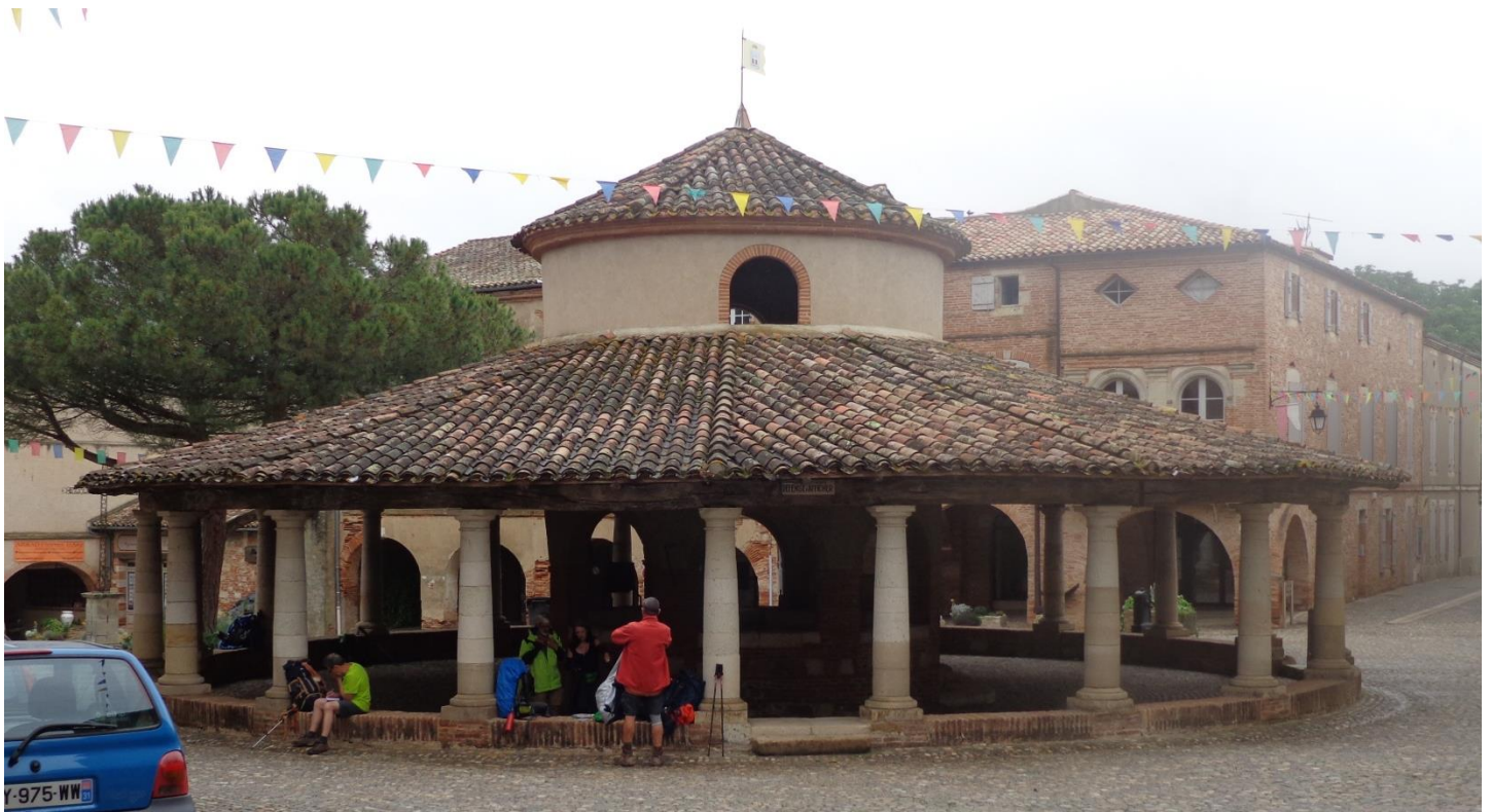
La belle halle d'Auvillar (Tarn et Garonne) où je termine ce département pour le BPF

Les premiers villages (Flamarens et Miradoux) se méritent par deux pétards puis au fil du chemin, le paysage s'adouci. Ici, la culture intensive du maïs est reine. Les hauts lieux du chemin continu, Lectroure, La Romieu (collégiale visible à des kilomètres), Condom (cathédrale), Lerresingle et Montréal (Eglise). Je m'arrête, rentre brièvement parfois mais sans visiter avec minutie les lieux. Le petit village fortifié de Larresingle et le pont d'Astingues auront mes faveurs de l'après-midi.