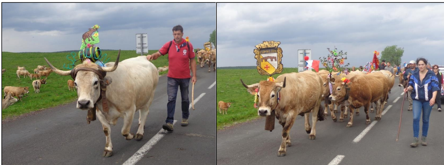
La fête de la Transhumance des Aubrac à Aubrac, le dernier week-end de mai

Le sud du plateau est surmonté par une petite crête que je franchis au col d'Aubrac 9 . La route est barrée, bénévoles, policiers et des barrières entravent la route. C'est le dernier dimanche du mois de mai, c'est la fête de la transhumance sur l'Aubrac. Des milliers de personnes, quelques centaines d'Aubrac, de belles brunes avec du mascara, remontent vers leurs résidences d'été. Quelle surprise, c'est du folklore mais c'est terriblement exotique.