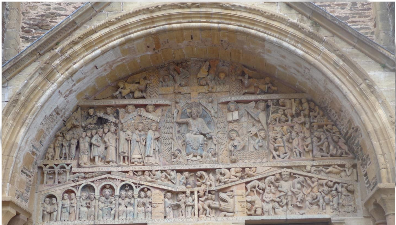
Le tympan de Conques. 124 personnages. Une finesse qui a traversé les siècles. Ici, la révolution n'a fait table rase et tête coupée d'une merveille

18h15, Je suis à mon étape de Conques. Des larmes coulent le long de mon visage. La fatigue ? La puanteur du randonneur ? La grâce de l'église et de son tympan ? L'accomplissement ? Sans doute de tout cela, mais ce soir, je visite, je flâne, je discute, je mange en terrasse, je dors dans un vrai lit. Ce soir, je fais ma diagonale le long du chemin de Compostelle.